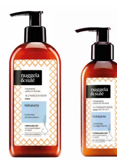
Formato 250 ml CN 180322.1