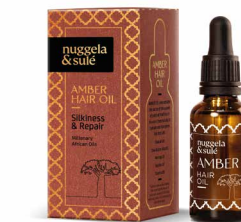
Formato 30 ml CN 209830.5

Usa el cepillo Tangle Tamer para aplicar y repartir la mascarilla, ayudará a desenredar tu cabello sin tirones y sin roturas.