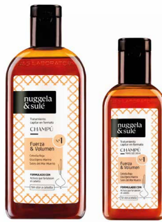
Formato 250 ml CN 174576.7